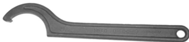
Figure 2. Clé à main 5053980