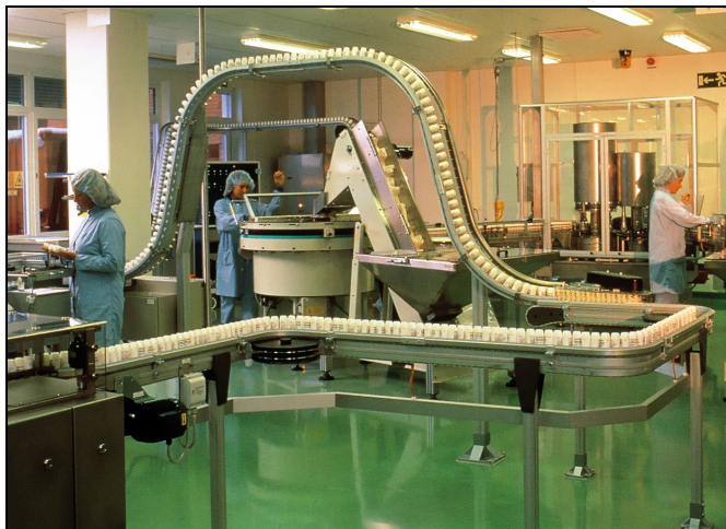
Abfüll- und Verpackungslinie für Inhalatoren