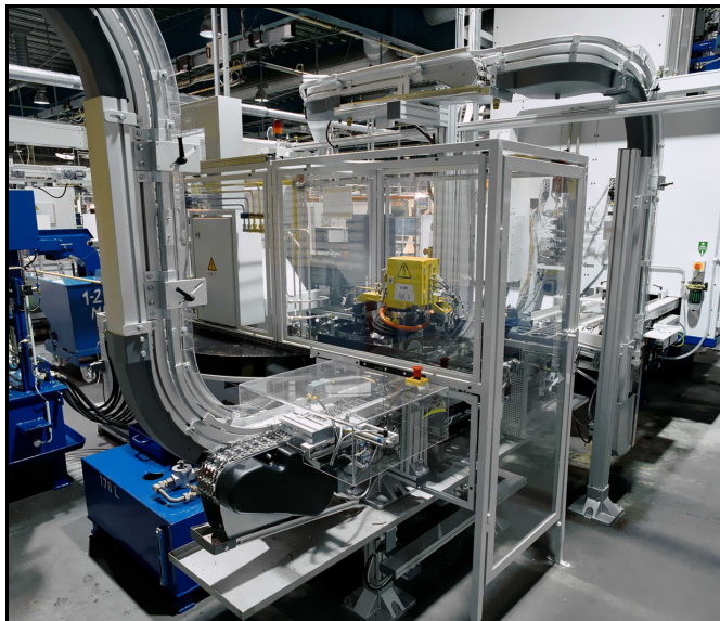
Automatische Fertigungslinie für Getrieberäder