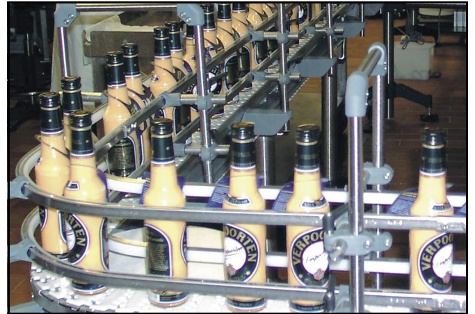
Hygienische Abfüll-Linie aus Edelstahl