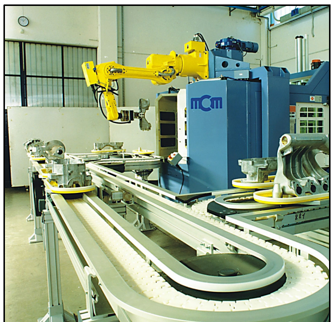
Highway und Satelliten-Konzept als Maschinenautomation