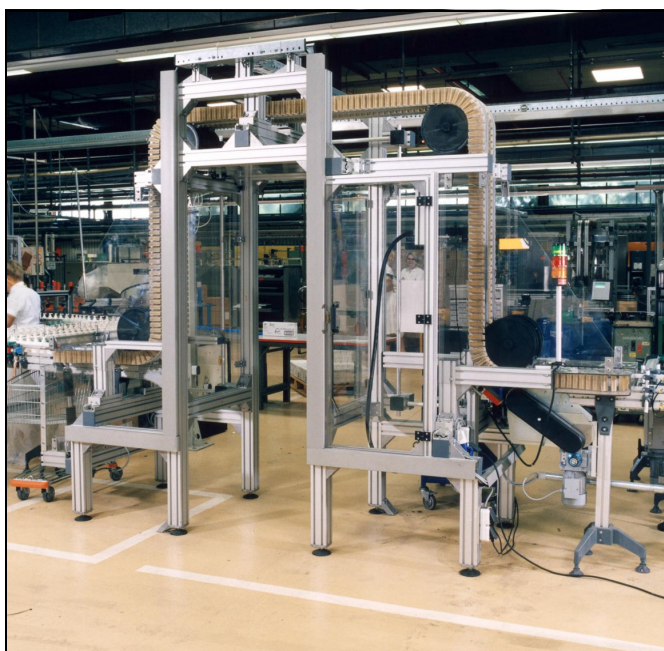
Multifunktionaler Klemmförderer für Kosmetikflaschen