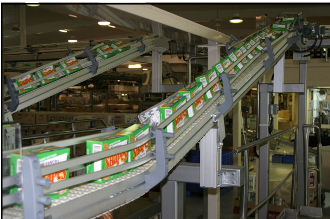
Kontinuierlicher Schrägtransport für Kartons