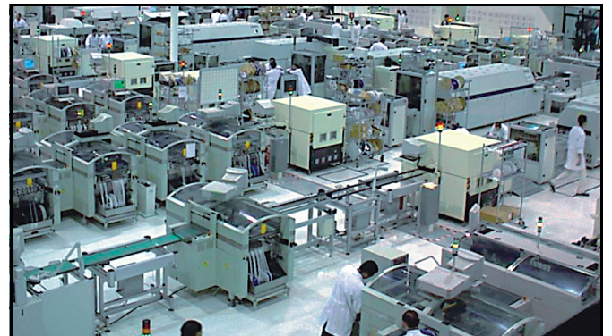
Montagelinie für Leiterplatten